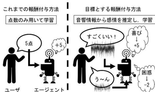
図 1: 報酬付与の違い

しかし、報酬として整数値しか受け付けていなかったこと、インタラクション実験がシミュレータ上でのみ行われていたため、実機ロボットにおける効果を確認できていないことなど、取り組むべき課題は多い。本研究課題では音声からの感情推定を利用してユーザの嗜好を獲得する手法の開発を目指す。図 1 にこれまで用いていた報酬付与方法と本研究課題にて目標とする報酬付与方法を示す。