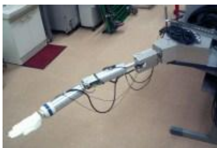
図1 ロボットアームの全容

本ロボットは、胴体、上腕、前腕、手部から構成され、各関節は次のような自由度を持ち、肩関節3自由度、肘関節2自由度、手関節2自由度、ほぼスイマーと同様の動作を再現することが可能である。本ロボットの動きは極めて再現性が高く、さらに各身体部に働く力や各関節に作用するトルク等が実測可能である。このロボットを用いて、トップスイマーの動作を再現させ、各部位および関節に生じる力やトルクを実測するとともに、手部表面の圧力分布と手部周りの流れ場の可視化を同時に行った。