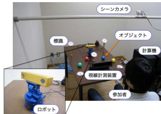
図2 実験環境とロボット

人とロボットは複数のオブジェクト (4色のゴムボール) を挟んでテーブルに向かい合って座る (図2)。ロボットには2種類の数理モデルを実装する。1つが反射的に親の視線方向を向く反射的注視ロボットであり、もう1つが意図的な内部状態によって親の視線方向を向く意図的注視ロボットである。