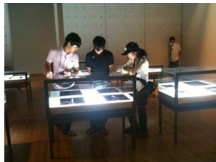
図3 解説者と来館者との身体配置によって、共同注視やノンバーバルコミュニケーションの頻度に差が生まれる可能性が示される。

とくに鑑賞者に相対するガイドが並列した立ち位置か対面した立ち位置かによって共同注視の頻度などに影響を及ぼすことから、解説エスコートにおける適切な身体配置への知見を得ることができた。また、共同注視が解消されるタイミングや身体配置の変化は、解説対象の展示物を次点へ変化させるキューともなりうる可能性が示された。