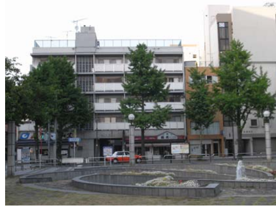
写真1： 現在も民間賃貸住宅として運営されている旧公団市街地住宅(福岡市内)

1983年度末までに譲渡された45住宅のうち、20住宅は現在まで建替えられることなく建物が維持されている。ただ、住宅地図上では居住者名の表記は少なく、業務・商業機能に転用されるなど居住機能は失われている場合が多い。関西で解体や建替が多く見受けられるが、いずれも近年おこなわれたものであった。