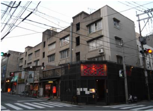
写真 2 : 譲渡後も健在の旧県営アパート（福岡市内）