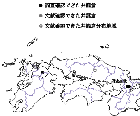
図2：近世～近代の民家校倉の分布 (西日本)

特に、秋田県内には角材を積み上げる校倉造の民家の倉庫建築である「タタミグラ」と、角材を立て並べる「縦タタミ(グラ)」がある。タタミグラは胡桃館遺跡の埋没建物と構造的には同じ分類であり、縦タタミは古代の城柵遺跡である払田柵(秋田県)や城輪柵(山形県)の角柱柵列と構造的に同じ分類といえる。そして、胡桃館遺跡埋没建物に確認される運搬に関わる技法が、払田柵・城輪柵の角柱柵列でも確認できること。また、両者ともに材積は通常の軸組建築をはるかにしのぐこと。これらから、タタミグラと縦タタミという、角材を横に積み上げる構法と角材を立て並べる構法は、共通の建築文化を背景にしている可能性が高い。また、秋田県内では、古代から近代まで、豊富な森林資源を背景に、木材をふんだんに使用した構法が受け継がれてきた可能性が指摘できる。