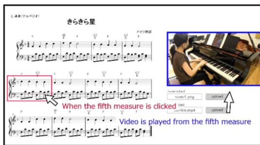
図1 楽譜クリック動画再生システム

(2)楽譜クリック動画再生システムの開発:レッスン動画中の音の変化と楽譜の音の変化と同じ場所を推定し,対象の楽譜をクリックされた時にその場所から動画を再生するシステムを開発した。図1はきらきら星のアルペジオ譜の例であり,図左はあらかじめアップロードされた楽譜,図右は動画の再生ウインドウである。図1では,5小節目をクリックした時に5小節目を演奏した時刻から動画を再生した際の画面をキャプチャしたものである。2023年に開催された SIGNAL2023にて「Development of a Score Click Playback System」と題して発表し,Best Paper Awardを受賞した。