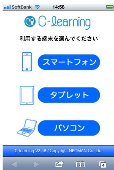
図 1 C-Learning での端末選択の画面

C-Learning は、PC のみならず、さまざまな携帯端末からも利用できる学習ツールである。このツールを開発した(株)ネットマンの協力を得て、ユーザインタフェース、授業で利用できる機能(たとえば、学生が相互評価を行うための「みんなで評価」)、教員が利用できる機能(たとえば、ダウンロードできるデータファイルの形式)の改善を行った。利用可能な端末として、iPad などのタブレット端末にも対応した。学生が C-Learning にアクセスすると、図 1 の画面が示され、利用する端末を選択することができる。