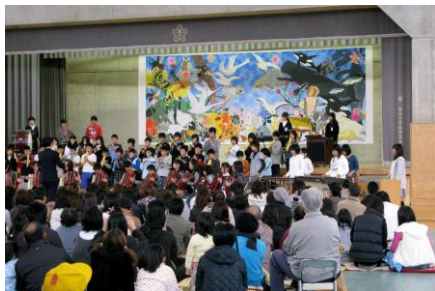
写真4 福島県岩江小学校実践

に喜ばれ、卒業記念のマグカップのデザインとして採用された。IT技術を用いた初のコラボレーションである。