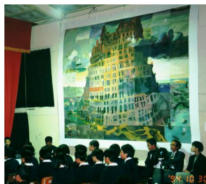
写真3 福島県都路第二中学校実践、1994年

(3) 福島県岩江小学校と連携して、共同制作プロジェクトを展開した。学校から非常