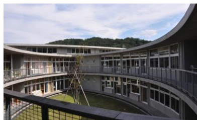
写真6.7 福井市至民中学校

(6) 平成24年に設置された伊達市立保原小学校は、校内に市のコミュニティスペースをもつユニークな学校建築である。福島大学人間発達文化学類は本校と研究協定を結び、本研究における造形活動においても研究連携を進めた。学生による制作チームを組織し、ワークフローを確立させながら、小学校と対話的に制作を進めた。課題となったのは420名もの児童作品のスキャニングと、その構成であったが、Scansnapの活用やPhotoshopCS6の活用によりクリアすることができた。