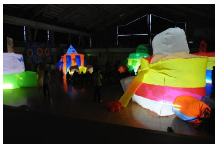
写真5 白方小学校「光の巨人」実践

(4) 折からの東日本大震災と原発事故の直撃を受け、いわき市の連携小学校とのコラボレーションは中断したが、それに対して被災地との連携を進め、立体的な作品のコラボレーションを進めることができた。体育館の空間を利用し、ビニールを貼り合わせた高さ4mほどの巨人を児童と共同制作し、暗闇の中で発光させ、大きな感動を呼んだ。