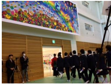
写真 8・9・10 伊達市立保原小学校プロジェクト

(7) 学校現場のコラボレーションにおいては、前半は大学主導で行ったが、後半では連携学校のニーズを作品に十分反映させるようになった。大学側が全体の印象や造形的な組み立てであるのに対し、学校現場のニーズは児童生徒一人ひとりの考え方や作品の取り扱いの公平性、さらには共同制作の行事の中での意味づけなどである。