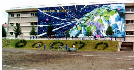
写真2 福島県下郷中実践、1989年

(2) プロジェクトにかかわる連携校との協議を進めると同時に、学校空間を利用した美術教育の展開例の調査を行った。80年代後期に全国的に大きく広がっており、それが90年代後半になるや習5日制への移行などが原因して、急激に縮小している点などが明らかとなった。また、そうした活動の多くが学校行事と連携している点、さらには生活指導実践として機能している点も明らかとなっている。