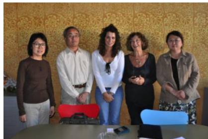
写真1 レッジョ・チルドレンにて

(2) プロジェクトにかかわる連携校との協議を進めると同時に、学校空間を利用した美術教育の展開例の調査を行った。80年代後期に全国的に大きく広がっており、それが90年代後半になるや習5日制への移行などが原因して、急激に縮小している点などが明らかとなった。また、そうした活動の多くが学校行事と連携している点、さらには生活指導実践として機能している点も明らかとなっている。