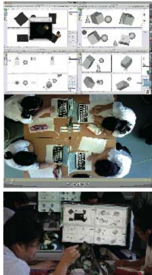
【図1】マルチモニタを用いた共同学習の様子（上段は表示画面（履歴として動画記録される），下段はその瞬間の実際の様子）