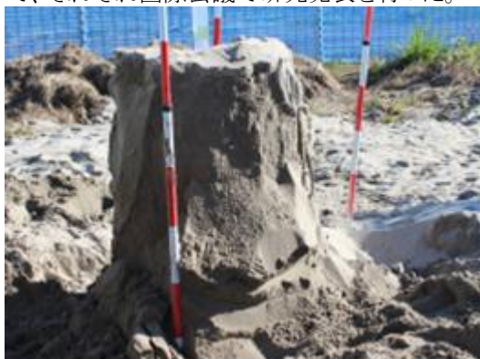
図2 現場実験において固化された砂円柱

その結果、微生物の浸透特性は土の透水性および浸透速度によって変わること、その特性によって固結領域が異なることが分かった。そこで、透水性の異なる砂試料を用いて一次元浸透における微生物の到達距離を固結領域から推定した(図1)。これから、粗砂、中砂および細砂におけるおおよその微生物の浸透特性が把握できた。次に土槽実験で微生物と反応液を混合した液材の注入実験を実施した。この実験では、砂の粒径、砂の厚さ、浸透速度、注入管の太さ等が浸透域と固結領域に与える影響を調べた。これらについては、飽和砂と乾燥砂に分けて、それぞれ国際会議で研究発表を行った。