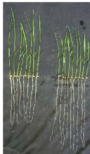
図 2. 培養 7 日目のサンプル。

カラーA4 ファイルケース (310×235×22 mm) の上部 10 mm を切断し、扁平形の培養容器とした。培養土を充填し、上部に発芽促進したイネを播種し発芽・発根、生育させた。灌水量を制御することで乾燥ストレス状態を作り出した。培養後、ケースを解体し、根を傷付けること無く採取した。