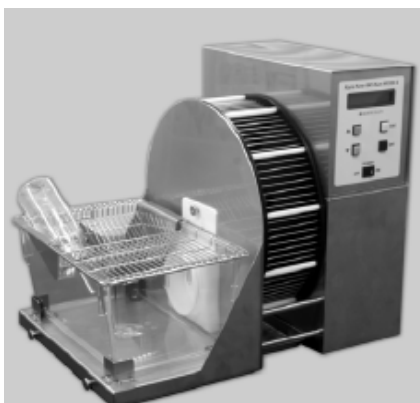
図 1 メモリー機能付ランニングホイール