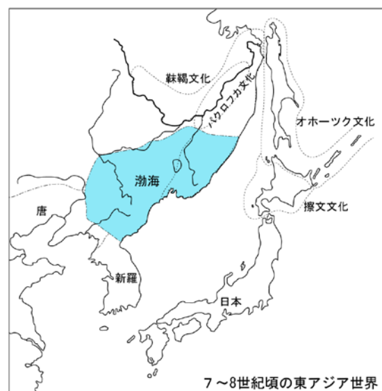
図 1 渤海の版図

「海東の盛国」と謳われた渤海（698～926）は、現在のロシア沿海地方から中国の東北地方、北朝鮮にまで版図を広げた国家（図 1）である。