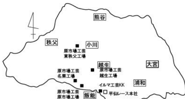
図1 平仙レース本社および姉妹工場の分布 『むつみ』16号(1968)64頁より作成。

本稿ではさらに、それらの経験の意味と地域の変化を地域の人々の視点からを検討するため、分工場が立地した名栗村に焦点をあてて、聞き取り調査によって住民の就業履歴を検討した(図1)。