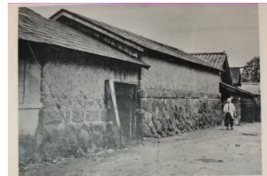
写真1：明治38年頃に建てられた堆肥小屋 3

農業三是の中、特に「堆肥」が重視された。『仁賀保町史』によると、明治39年(1906)より旧由利郡小出村では、年2回の堆肥品評会が実施され、堆肥小屋の建築奨励も行われた。昭和2年から昭和26年にかけて秋田県旧仁賀保町小出村の堆肥小屋の普及率は85%に達し、総面積は3,200坪 3 であった。