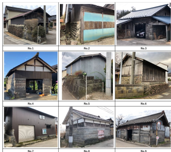
表1 畑福田における堆肥小屋の外観

にかほ市畑福田は45世帯であり、目視で判断できる堆肥小屋は9軒であった。集落に残存する堆肥小屋の現存実態及び外観写真は表2、表3に示す。現存する堆肥小屋の中、8軒が道路沿いに配置されるのに対し、敷地の奥に配置されるのは1軒のみであった。外壁の張り替えや扉の新設等の改修がほとんどの堆肥小屋