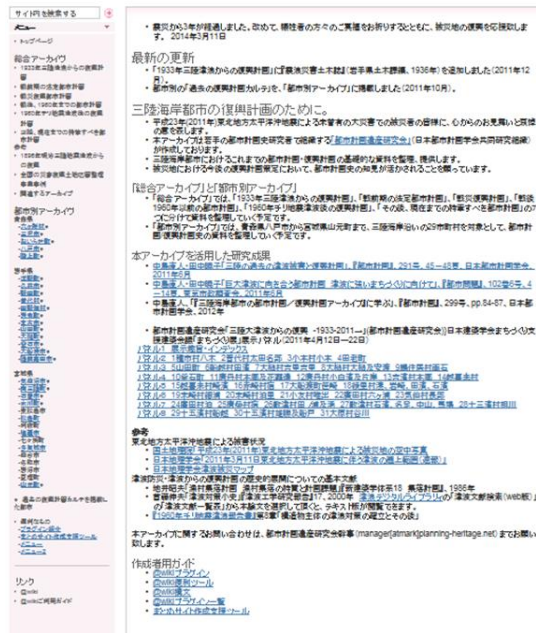
図3 三陸海岸都市の都市計画／復興計画史アーカイブの公開画面