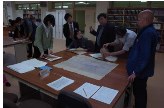
図5 中国研究者との共同史料調査