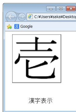
図 1 漢字表示

表示できる漢字は 2966 字(図 1 参照)で、各漢字の筆順を表示することができる(図 2～図 4 参照)。