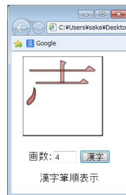
図 4 筆順 (3)

図 5 は、漢字筆順全体をわかりやすく表示した様子である。これらのコンテンツで表示している筆順フォントのデータは、日本語教育支援システム (CASTEL/J) が開発した筆順辞書データベースの入力データをそのまま利用している。