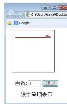
図 2 筆順 (1)