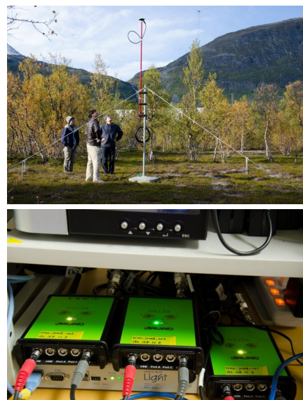
図1：ノルウェーのトロムソ EISCAT レーダー・サイトに設置したアンテナ(上)と受信機(下)。

国立極地研究所がノルウェー・トロムソに設置している全天カラーデジタルカメラで、2012年11月20日16時UT前後にオーロラブレイクアップが観測され、オーロラの発光領域は時間の経過とともに北西方向に動いていた。この時間帯にGNSS受信機で観測されたGPS衛星PRN20の電波から求めたドリフト速度は、東西方向が西向きに300-900m/s、南北方向が北向きに250-650m/sであった。その結果は、GNSS受信機で観測したドリフト速度は電離圏プラズマのドリフト速度であることを示している。また、この時、GPS衛星PRN20の電波が電離圏を通過する場所は、フィンランドに設置されたSuperDARN HFレーダーによっても観測されていた。HFレーダーの観測結果は、西向きに100m/sのドリフト