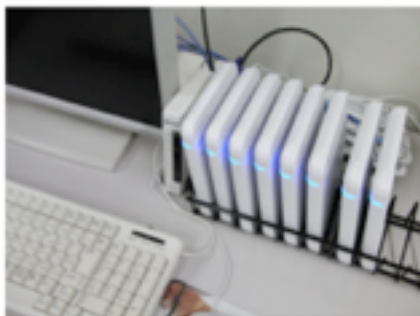
図 1 改良クラスタ PC

Intel Atom D510 を搭載した小型 PC を 8 台準備し、これらを計算ノードとするようなネットワーク接続型の小型クラスタ PC を新たに試作した(図 1)。クラスタ PC の OS には、PC クラスタコンソーシアムが開発している SCORE を採用し、並列処理プログラム開発が容易に実施できる環境を構築した。この改良クラスタ PC は、以前の研究で用いていたクラスタ PC よりも性能が高く、従来よりも高度な画像処理が可能である。簡単な処理性能比較を試みたところ、処理時間を約 1/5 程度にまで短縮できることが判明した。