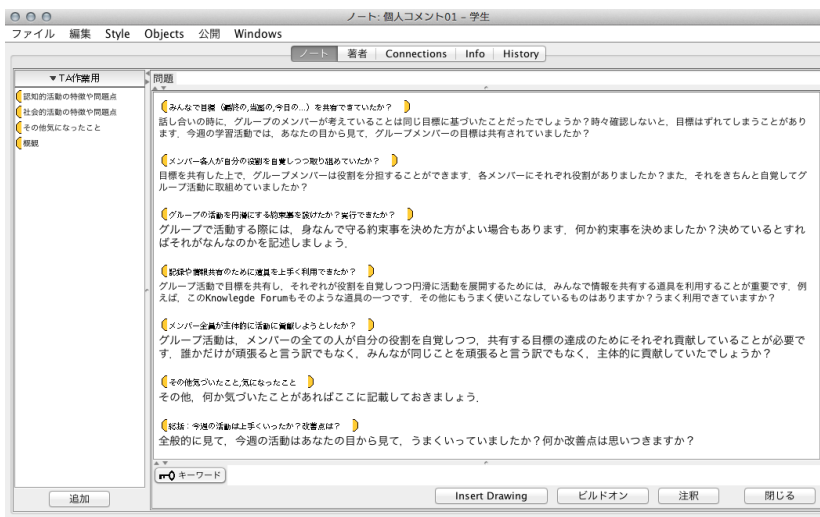
図2 個人での振り返り記述方法の例

鉄の骨 第1回 活動システム図 10月 9日 学籍番号: 名前: ★分析を補助として、この用紙を使いましょう。2枚目に書きづら内容で、ここで示しても構いません。