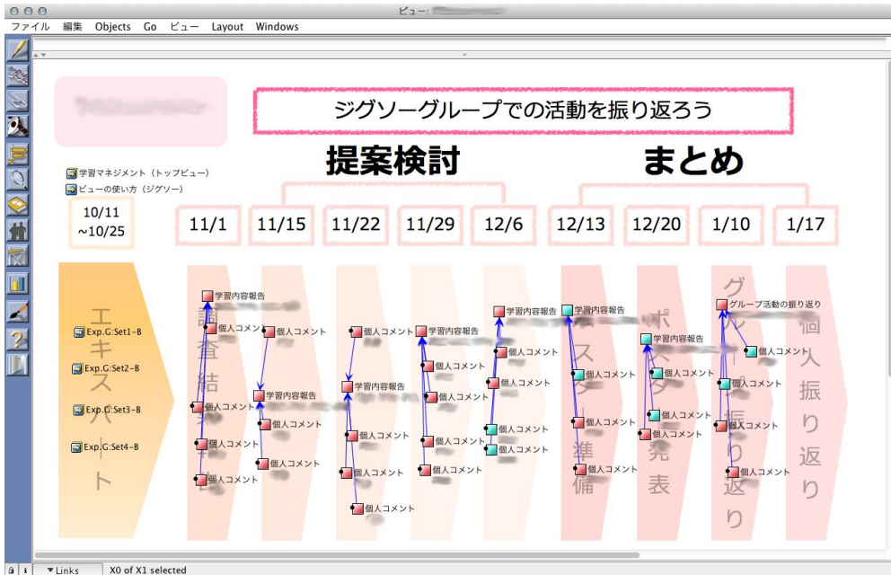
図1 グループの活動状況