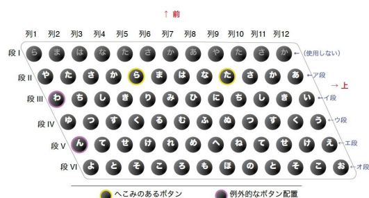
図2 兄弟式日本語ボタン音素変換標準規格 (BBPTSJ)のボタン配列 (シングルボタン)

この BBPTSJ 規格では、研究当初の目標である「すべての日本語音素をアコーディオンのボタン操作で指定すること」を実現しており、ボタン配列にも合理的な規則を適用して、覚え易さに一定の配慮をしている。しかし、実際の演奏 (操作) では、ボタンを押す指の大きな跳躍が避けられず、インターフェイスの身体性の面で改善の余地を残したものとなった。