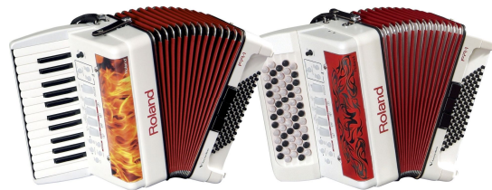
図1 ROLAND V-Accordion FR-1 (左) と FR-1b (右)

(1) インターフェイス (ハードウェア) インターフェイスとなるアコーディオンは、ROLANDが開発した MIDI 対応電子アコーディオン「V-Accordion」シリーズの FR-1 (右手ピアノ式鍵盤タイプ) および FR-1b (右手ボタン・タイプ) モデルを購入し用いた。この電子楽器は、ボタン・鍵盤・蛇腹などの演奏情報を MIDI メッセージとしてリアルタイムに送信する機能を持つ。