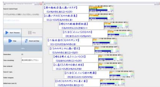
図 2 本研究で実装し、文章生成問題における CEUS の検証に用いたシステム (アナグラム文生成システム)