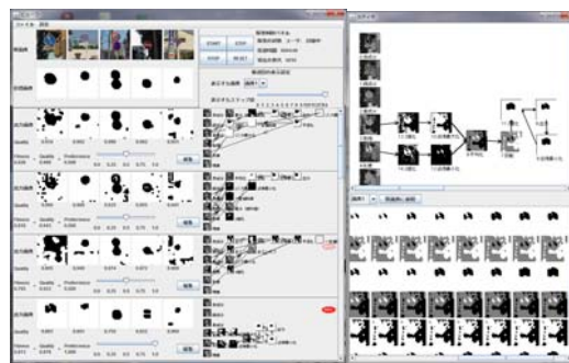
図 3 本研究で実装し、ネットワーク生成問題における CEUS の検証に用いたシステム（画像処理フィルタ生成システム）

進化計算による探索領域の集中化と多様化の制御に関しても同様に、利用者の集中的、発散的思考に大きく作用する。CEUS は利用者