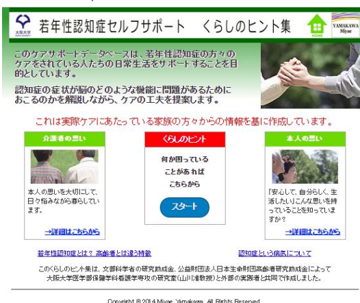
図3 開発したデータベースのトップページ「若年性認知症セルフサポート 暮らしのヒント集 http://miyataabu.net/livingsupport/ 」