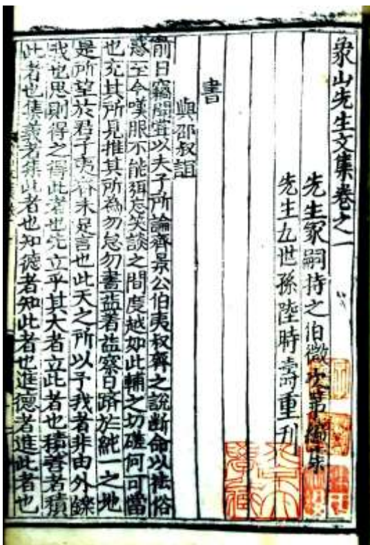
図1：北京大学図書館所蔵