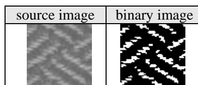
図 1 : グレイスケール画像と 2 値画像