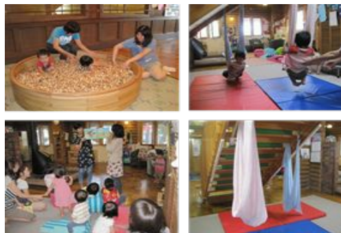
プレセター-の写真

その他にも、プレセター-群は仲間と共に成長しているという主体的な成長への回答が多く、一般群は初めての子育ての入口、家では得られない体験の場所、家以外の居場所作りとして支援センターを利用しているという実態が明らかになった。