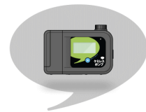
図 4:宅配型小型ポンプ

度との関係を分析、明確にする。希望があれば、シックハウス症候群の疑われる患者にケ