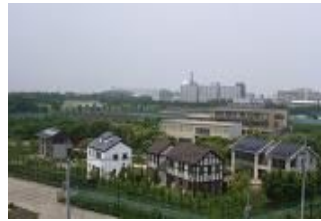
図 1:ケミレスタウン

本研究は千葉大学柏の葉キャンパスの「ケミレスタウン」(Mori & Todaka, 2009)内の各