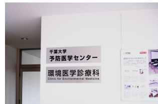
図 3:環境医学診療科

タウンで、住居ラボ(戸建住宅型実験棟群) ユニラボ(プレハブ実験棟) テーマ棟(教室、診療科、ギャラリー)からなっており、ケミレスタウン内に設置されている「環境医学診療科」(図 3)では、実際に医師による「シックハウス症候群」が疑われる患者の診療、相談がおこなわれている。