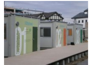
図 2:プレハブ実験棟