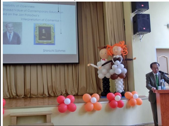
サンクトペテルブルクで報告する研究代表者

2014年夏から1年間は、所属機関の海外研修制度によって、チェコ共和国科学アカデミー哲学研究所で客員研究員として、本研究課題の遂行に全力を傾注した。その際、科研費の制度改革によって海外研修中における研究費の使用が容易になったことで、ロシア・サンクトペテルブルクやアメリカ・ニューヨークでの学会に出席し、研究発表し、世界各国の研究者と意見交換できるなど、大きく研究を進めることができた。ロシアでの研究発表は高い評価を得ることができ、専門誌に論文が掲載された。