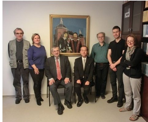
チェコ共和国科学アカデミー哲学研究所にて (中央右:研究代表者)

本書は、「図書新聞」2015年1月号で紹介されたほか、教育哲学会、教育史学会でも紹介され、「これまでのコメニウス像を見直すもの」として高い評価を受けた。