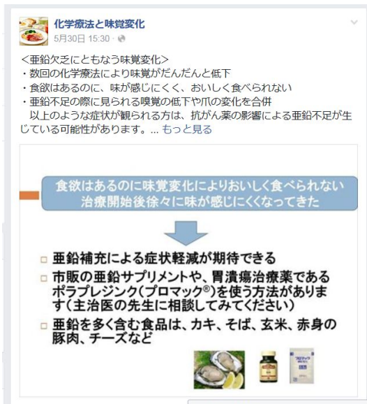
図4 閲覧者が多かった投稿内容

SNS への投稿内容と、閲覧者への到達状況を示す「リーチ」の関係を見ると、有用と思われる内容であっても、文字情報だけの投稿では閲覧者の拡大ができていない一方、写真やスライド画面を活用した投稿は閲覧者が一気に増加することが分かった(図4)。閲覧者を増加させ、味覚変化の問題を抱える患者や家族に情報を届けるためには、関心をひきやすい写真や図などの工夫が必要である。