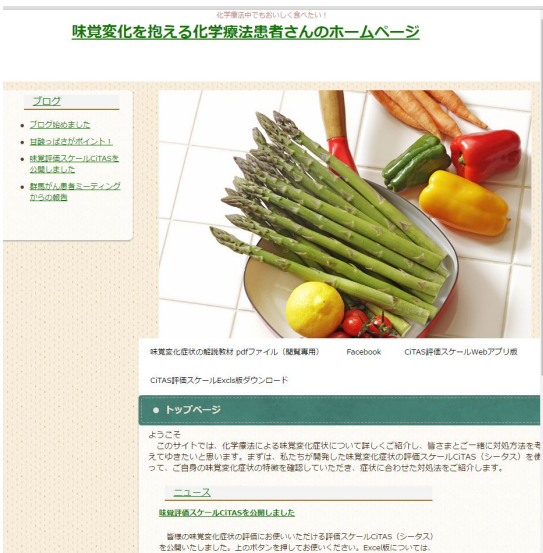
図3 デザイン見直し後の Web サイト

この結果、がん対策イベント関連のページからアクセスする利用者が増加したが、ページに対する応援メッセージはあるものの、ナレッジデータベースに追加可能な対処法等に関する書き込みは得られなかった。このため、2016年3月にA県内患者会の支援を受け