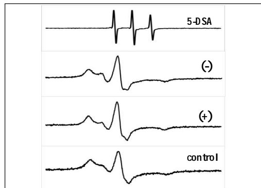
図 1. (5-DSA)上のスペクトルは、皮膚試料に用いる溶液である。(-)治療薬を用いる前の皮膚乾癬の角層のスペクトル。(+)治療薬を用いる前の皮膚乾癬のスペクトル。(Control)正常な皮膚角層のスペクトル。

一方、治療後の皮膚サンプルでは、角層脂質構造の正常化により、コントロール(正常)