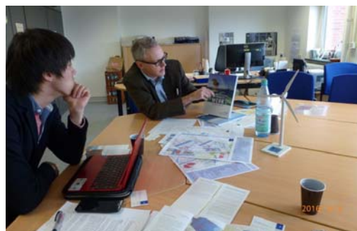
写真 1. ドイツ・連邦開運水路庁への聴き取り (Hamburg, 2016.3)