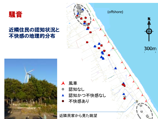
図 1. 騒音の影響認知と不快認知の分布