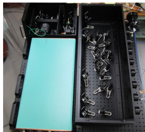
図 1 UV パルスレーザー照射システム

観測装置打ち上げ後、研究計画期間内に初期運用フェーズでの観測データが取得できる。地上試験および軌道上で取得したデータを用いて各チャンネルの較正を行う。この較正データおよび計算機シミュレーションに基づくデータ解析によって、カスケードシャワー発達の詳細な測定から入射粒子のエネルギーの決定及び粒子種の選別を行い、多数の陽子バックグラウンドを含む観測データ中から高エネルギー電子候補イベントを選別する。