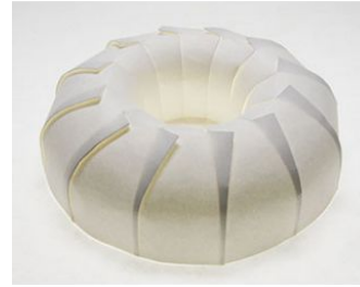
図3 矩形の紙に小さな切り込みを入れることで制作されたトーラス状の折り紙

(5) 平行な切り込みの入った矩形の素材を曲げることで得られる幾何形状を対話的操作で實現するためのシステム開発を行った。素材から得られる形状を三角形メッシュ表現し、素材が伸縮しないという制約の元で滑らかな曲面形状が得られるよう、メッシュを構成する頂点の座標を数値最適化手法で求めることを行った。その結果、椅子形状などを設計できることを確認し、塩ビ素材を用いた試作を行った。また、これ以外にも、小さなスリットを入れるだけでトーラス形状などを容易に制作できることを確認した(図3)。