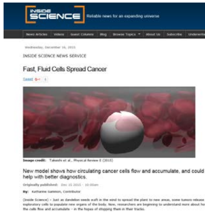
図2：循環腫瘍細胞の流動(米国物理学協会の運営するニュースサイトで紹介.)

(4) 微小血管中を流動する循環腫瘍細胞の挙動を初めて解析し，血管径の増加に伴い，赤血球集団との流体力学的相互作用の変化により流動形態が変化することを明らかにした(図2)。またこの計算技術を基に，循環器系の分子-細胞-組織(細胞集団)間相互作用に対する解析プラットフォームを構築した。