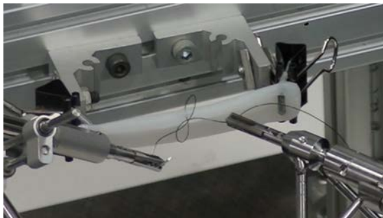
図 2 HEM 2 による自動縫合と自動結紮実験