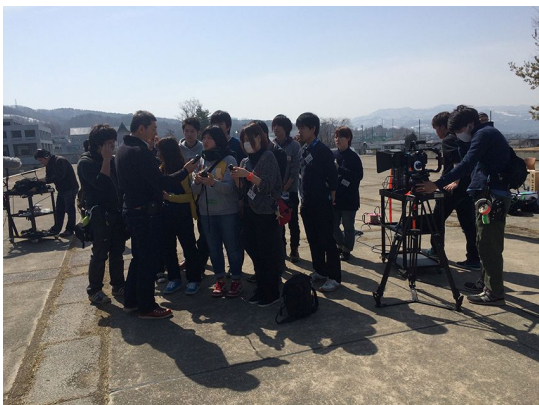
ワークショップの様子

を目的とするのではなく、撮影からポストプロダクションの各ステップを学生が実際に学んで、デジタルシネマの検証をめざすワークショップを開催した。ここでは、4K からスマートフォンにいたる様々な撮影機材を用いて、1シーン程度を同時撮影し、その素材を学生自らがDCPにした。こうした一連の検証作業によって、デジタルシネマの特徴を体験的に学ぶことを目的とした。