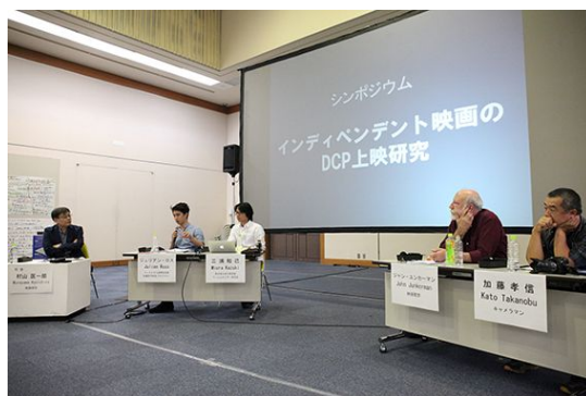
国際シンポジウムの様子

「デジタルシネマ時代のインディペンデント」をテーマにトーク・ディスカッションによるイベントを開催した(2016年3月5日-6日)。韓国からインディペンデント映画の制作者を招聘し、映像を専門とする学芸員や映画作家とともに、国内外におけるデジタル環境での映像表現の可能性をトークと上映から様々に検討した。