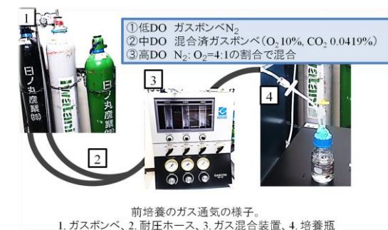
図 1. 前培養の際のガス通気の方法

前培養では、落葉をディスク状に切り出し、洗浄後、改変 \text{LCA} 液体培地 ( \text{LCA} 培地の無機塩類のみ含む) 中で振とう培養した。液体培地には 1 日 1 回、窒素・酸素・二酸化炭素の混合ガスを通気して、溶存酸素濃度が低酸素 (3.4~24.4%)、中酸素 (31.8~52.0%)、高酸素 (71.2~100.4%) となるようにして、20°C で 1 週間培養した (図 1)。これにより、異なる酸素条件に適応した菌の生育を助長し、活性化することを意図した。