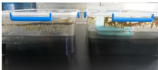
図3. ヘドロ釣菌法。密閉容器にヘドロを入れ、水面にアネロパックの酸素濃度調整剤を浮かせた。ヘドロ表面に基質となる滅菌した落葉を餌として設置して培養した。

③汽水湖の底部から採取した落葉などの植物基質は、洗浄後、コーンミール海水寒天培地(CMSWA; 塩分濃度19‰)で、アネロパック微好気(O 2 =6-12%)および嫌気(O 2 <0.1%)を使用して培養を行い、出現した菌を分離した。また、湖底のヘドロを採取して、その中に滅菌したアラカシ、コナラの落葉を基質として添加して嫌気環境下で培養する釣菌法も行い、2ヶ月間の培養後、落葉を上記と同様にCMSWAで培養して菌の分離を行った(図3)。