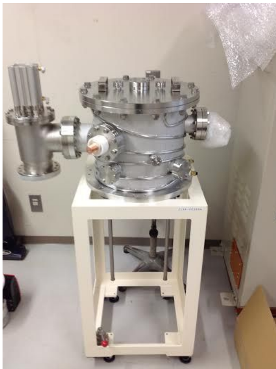
図 4：作成した真空高温加熱装置（アルバック社特型）。

作成した真空高温加熱炉は到達真空度が 10^{-4} Pa，最高到達温度は 1500 であり，設計どおりの装置の作成に成功した。