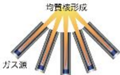
図 2: 複数ガス源からの原子ビームの収束による過飽和環境作成のコンセプト図。

管から放出されるガスフラックスの空間分布が理論的考察 (Dayton 1956) と一致することは確認されており (e.g., Guevremont et al. 2000; Tachibana et al. 2011), この手法を用いて鉄蒸気圧の空間分布 (= 過飽和比の空間分布) を制御し, 局所的に過飽和条件を作成する (図 2)。