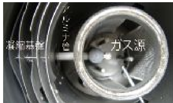
図 1: Tachibana et al. (2011)での金属鉄凝縮実験セッティング。金属抵抗加熱真空炉内部を上から撮影。右側のリング上構造がタングステンメッシュヒーター。左側の金属層はリフレクタでヒーターからの輻射を反射する。金属鉄を入れたアルミナ管は自作のグラフィット台座に設置する。アルミナ管を通して、放出された鉄蒸気は、リフレクタの穴から外に放出され、同様に低温部のリフレクタの穴部に吊された基盤上に凝縮する。右下からヒーター中央に伸びているのは温度制御用熱電対。

金属鉄均質核形成実験装置の開発をおこなう。Tachibana et al. (2011) では基板上での金属鉄成長実験において、アルミナ管底部に設置した金属鉄ペレットを真空炉内で加熱し、集束して放出される鉄蒸気を低温部の基板上で凝縮させる実験をおこなった (図 1)。