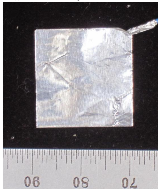
図 1 : 体内・体外用電極