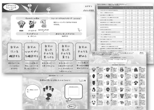
図2 レジリエンス・トレーニング画面