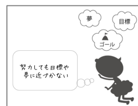
図1 落ち込み場面の例

潜在的レジリエンスのアセスメント：P-Fスタディにおけるフラストレーションの6分類(欠乏・喪失・葛藤 [要求がどのように満たされないか]×外部的・内部的[満たされない要因])(Rosenzweig, 1938)に基づき、一般場面と対人場面について12の落ち込み場面を作成した(図1)。ネット調査会社を通して20歳~30歳の大学生500名、社会人500名(男女同数、平均年齢24.08歳( SD = 3.61 ))に調査を行い、各場面に対して、絵の中の人物の気持ちがどうしたら楽になるか、一言アドバイス(30字以内)を自由記述で回答するように求めた。その後、まずは場面1、場面2についてKJ法を用いて自由記述の分類を行い、カテゴリ間の関係から全体の構造を推測した。