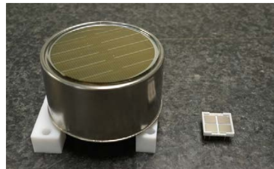
図2 新開発の光センサー（右）と従来の光電子増倍管