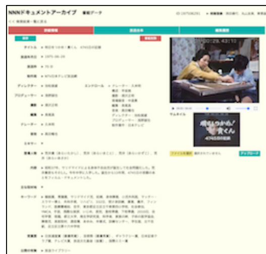
図1 NNN ドキュメント研究用デジタルアーカイブシステムの画面

今回、独自に開発した NNN ドキュメント研究用デジタルアーカイブシステムは、研究会メンバー（研究代表者、研究分担者、制作者の他、大学院生約20名が参加）がインターネット上で番組を自由に検索・閲覧し、データベースを作成できる画期的なシステムである（図1）。