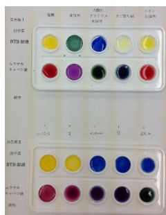
図 1 呈色板による「水溶液の仲間分け」