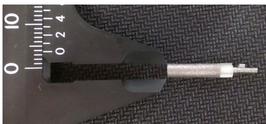
図3 3Dプリンターで作製した超小型大気圧低温プラズマプローブ

今回、我々は、超小型大気圧低温プラズマプローブを3Dプリンターにより作製した。3DプリンターはCADの設計により、継ぎ目のない鎖や複雑な水路、切削加工では不可能な微小な構造などが金属や樹脂で精密に造形できる。3Dプリンターは小型の放電電極の中に微細な水冷チャンネルを配置するなどの自由な加工が出来るため、放電部の小型化とプラズマの高強度化を両立できる。また用途に合わせたプラズマ生成部の構造を短時間かつ安価に設計・作製できるため、表面処理などの産業応用のみならず、医療用機器としての利用も期待できる。従来の機械加工では作製が困難な直径 3.7mm、重さ 3.5g のチタン製の超小型大気圧低温プラズマプローブを造形し、高強度なプラズマを安定的に生成することを確認した。図3は作製した超小型大気圧低温プラズマプローブを示す。